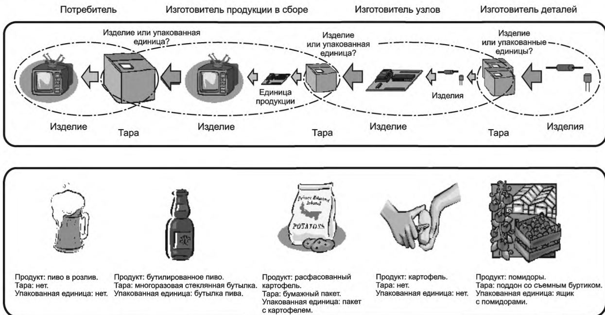
Рисунок А.1 — Изделие (продукт), упакованная единица продукции и тара в различных вариантах использования

На рисунке А.1 представлена сущность проблемы и приведены основные рекомендации для пункта выдачи ключевых идентификаторов по корректному, насколько это возможно, присвоению наиболее подходящего идентификатора объекту (изделию (продукту) или упакованной единице продукции).