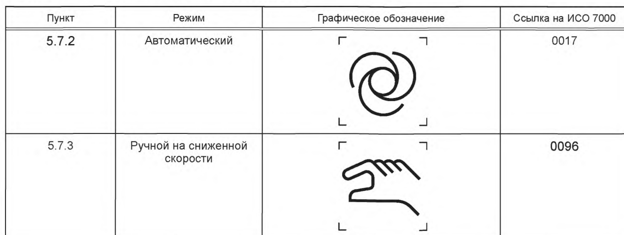
Таблица Е.1 — Обозначения режимов работы робота

В таблице Е.1 приведены примеры графических обозначений, которые могут быть использованы для обозначения режимов работы, определенных в 5.7. Дополнительный описательный текст может быть добавлен к графическим обозначениям для того, чтобы как можно яснее представить информацию о выборе режима и ожидаемых характеристиках.