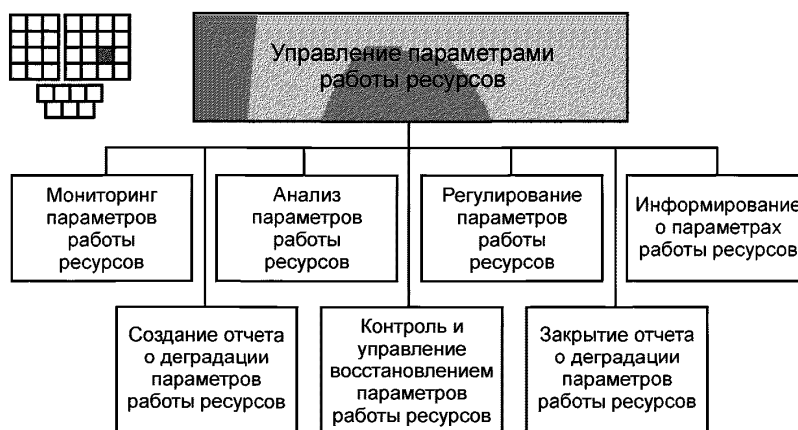
Рисунок 3 — Декомпозиция процесса 1.1.3.4 — «Управление параметрами работы ресурсов» на элементы процессов уровня 3

6.2 Процесс 1.1.3.4 и его элементы процессов уровня 3 предназначены для управления, контроля, мониторинга, анализа, информирования и регулирования значений параметров работы ресурсов на основе исходных данных, получаемых от процесса 1.1.3.5 «Сбор и распределение данных о ресурсах». Процессы 1.1.3.4 должны выявлять нарушения допустимых порогов параметров качества работы ресурсов и оценивать вероятность, в этих случаях, нарушения порогов для параметров качества оказания услуг. Информация о нарушениях порогов должна передаваться процессам 1.1.3.3 «Управление авариями на ресурсах» и процессам 1.1.2.4 «Управление качеством услуг» (см. ГОСТ Р 53633.4, (раздел 7)) для принятия решений по устранению проблем.