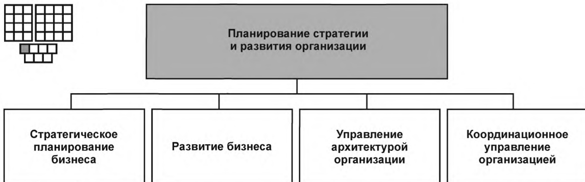
Рисунок 3 — Декомпозиция группы процессов «Планирование стратегии и развития организации» на элементы процессов уровня 2

6.2 Процессы группы 1.3.1 предназначены для стратегического планирования бизнеса, для планирования развития организации и координации планов производственной деятельности всех структурных подразделений организации.