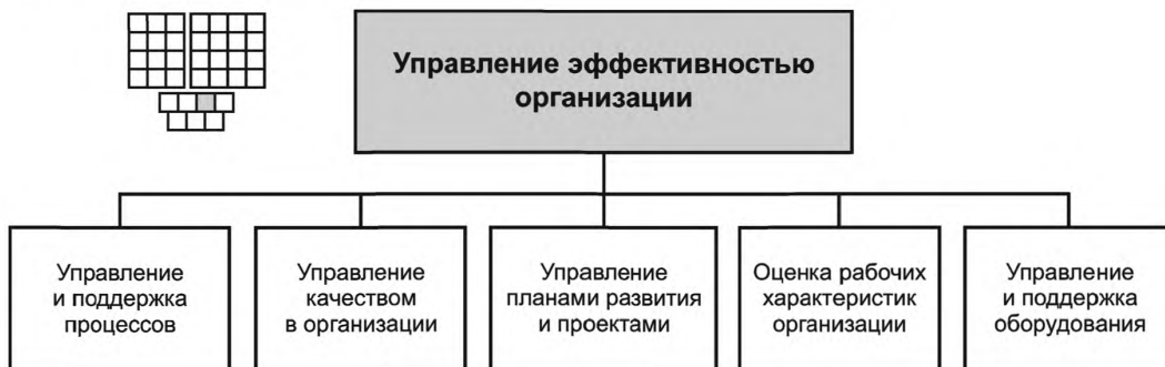
Рисунок 3 — Декомпозиция группы процессов «Управление эффективностью организации» на элементы процессов уровня 2

6.2 Процессы группы 1.3.3 предназначены для управления деятельностью организации с целью обеспечения рационального и эффективного выполнения производственных процессов.