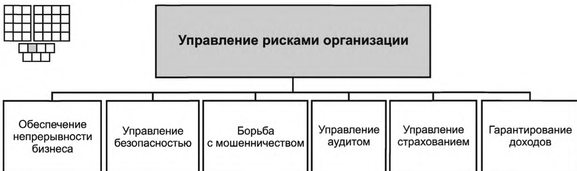
Рисунок 3 — Декомпозиция группы процессов «Управление рисками организации» на элементы процессов уровня 2

6.2 Процессы группы 1.3.2 предназначены для выявления рисков и угроз потери доходов или репутации организации, кроме того, они должны обеспечивать минимизацию или устранение влияния выявленных рисков. Обнаружение рисков должно осуществляться как для физических, так и для логических/виртуальных рисков.