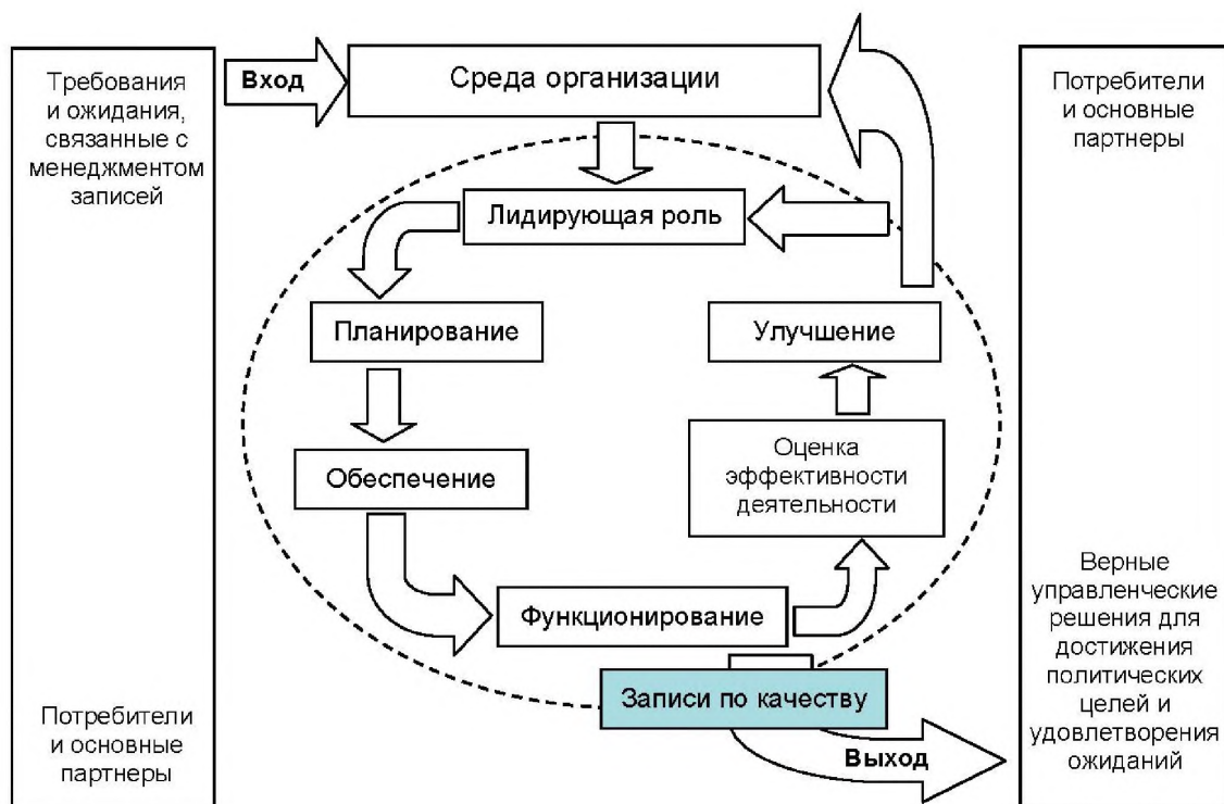
Рисунок 2 — Структура СМЗ