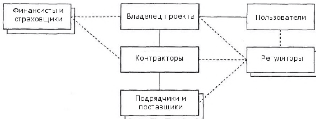
Рисунок 1 — Заинтересованные стороны проекта

и) других заинтересованных лиц, включая подрядчиков, поставщиков и заинтересованные стороны, имеющие свой интерес в проекте и в его результатах, пользователей и бенефициаров проектных активов, продуктов и услуг.