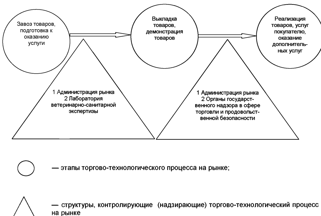
Рисунок 1 — Торгово-технологический процесс на розничном рынке

6.4 За нарушение правил организации деятельности по продаже товаров (выполнению работ, оказанию услуг) на розничных рынках предусмотрена административная ответственность согласно [19] (статья 14.34).