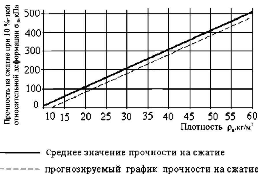
Рисунок В.1 – Зависимость прочности на сжатие при 10 %-ной относительной деформации от плотности (косвенный метод); 1 - a = 0,90 ; n = 495

Регрессия для \rho_a \geq 11 \text{ кг/м}^3 ;