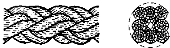
Рисунок 3-Конфигурация 8-рядного плетеного каната (тип L)