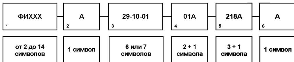
Рисунок А.1 – Структура ОМД

А.3.1 ОМД состоит из структурированного набора элементов, каждый из которых представляется одним или несколькими алфавитно-цифровыми символами (рис. 1).