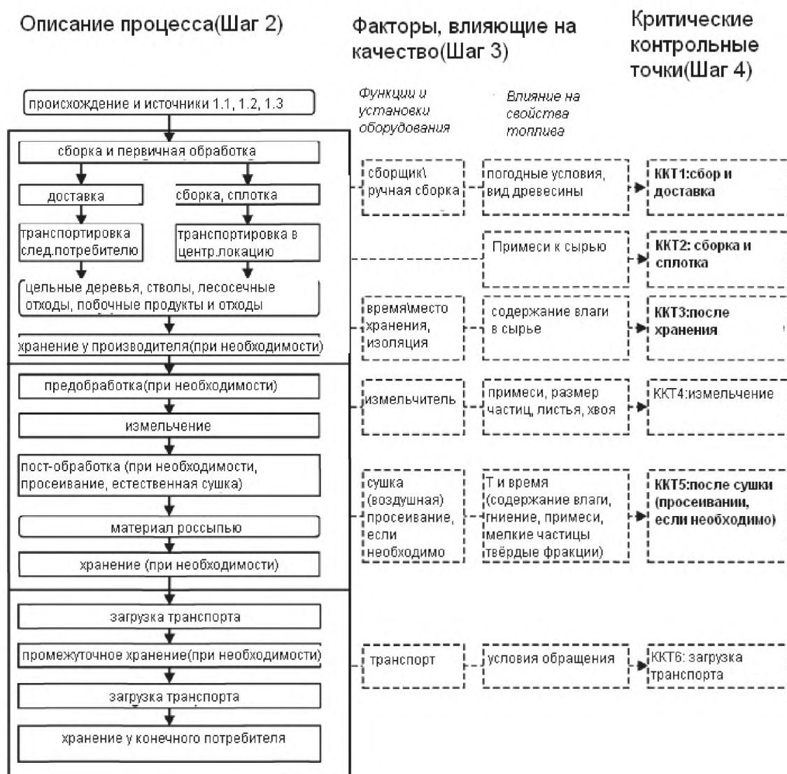
Схема 2 – Пример описания процесса производства с факторами, влияющими на качество, и критическими контрольными точками

Примеры описания процесса, включая соответствующие факторы, влияющие на качество, и критические контрольные точки (ККТ) приведены в схеме 2.