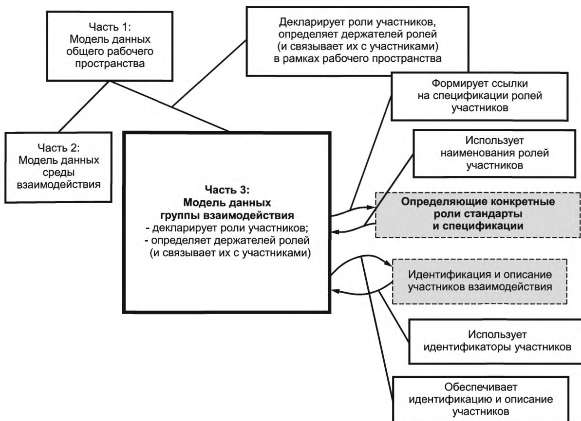
Рисунок 1 — Определение ролей , держателей ролей и назначение участников взаимодействия в настоящем стандарте