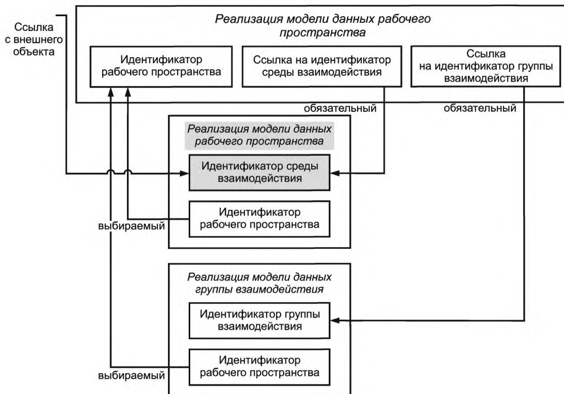
Рисунок 3 — Связи между средой взаимодействия , общим рабочим пространством и группой взаимодействия

Данная ссылка на идентификатор является дополнительной, так как в некоторых случаях эта ссылка может не потребоваться.