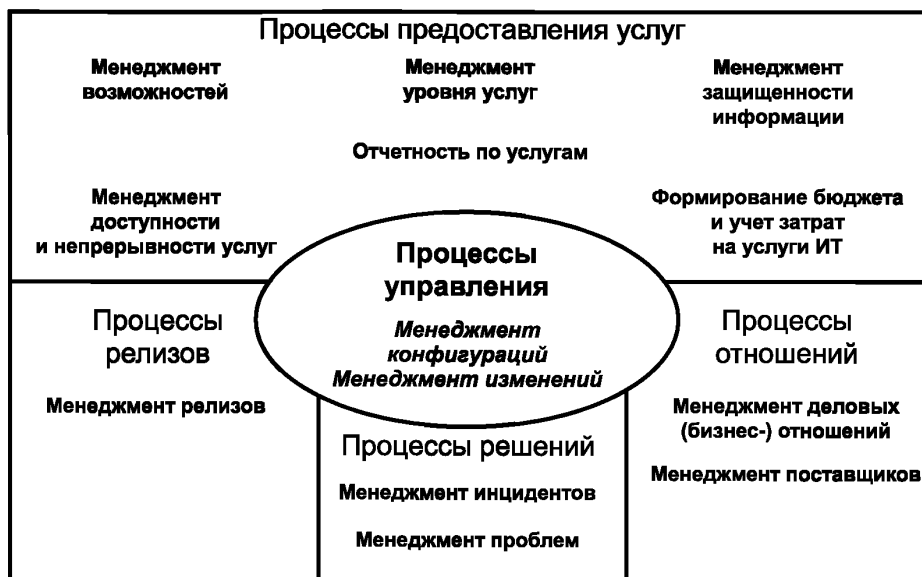
Рисунок 1 — Процессы менеджмента услуг