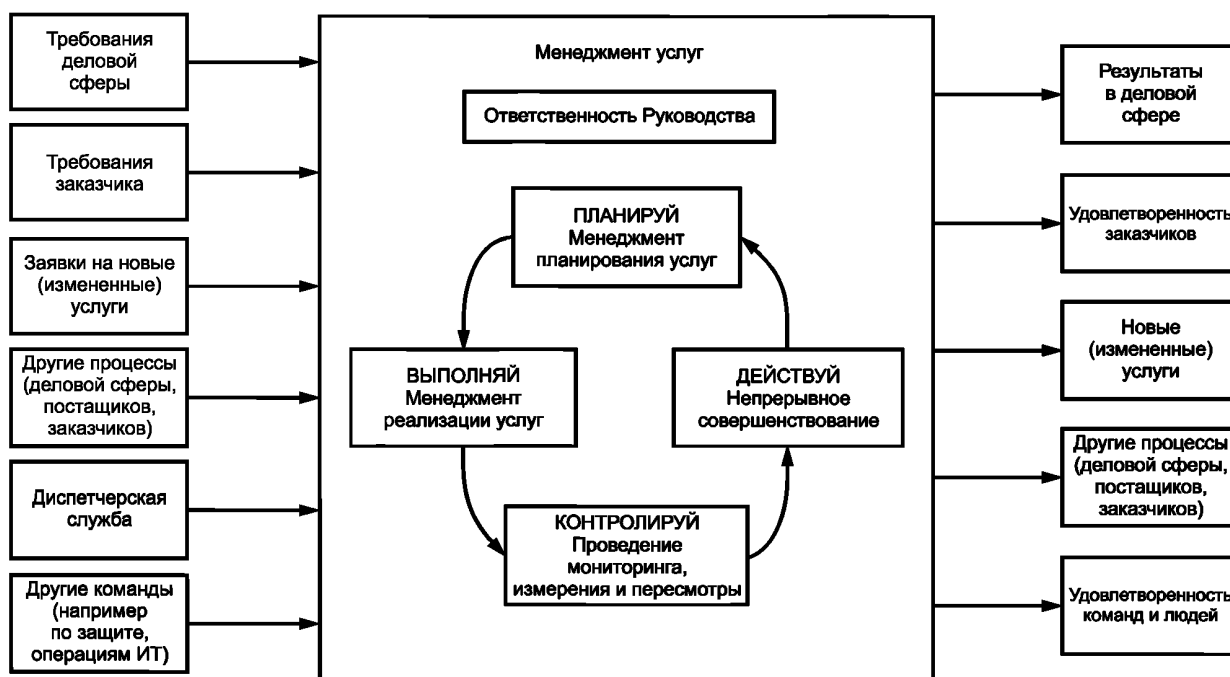
Рисунок 2— Применение методологии «Планируй — Выполняй — Контролируй — Действуй» к процессам менеджмента услуг

Модель, приведенная на рисунке 2, иллюстрирует данный циклический процесс, а также связи процессов, представленных в разделах с 4 по 10.