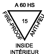
Рисунок 2 — Пример маркировки

Пример маркировки прозрачного термически закаленного безопасного стекла с основным стеклом толщиной 15 мм, имеющего тип огнестойкости «А-60», приведен на рисунке 2.