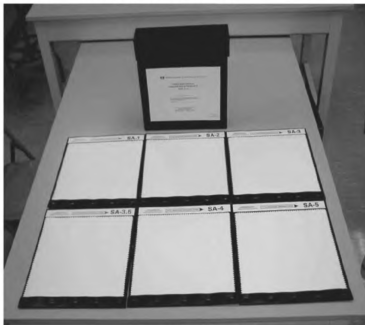
Рисунок 2 — Трехмерные эталоны гладкости

4.3 Трехмерные эталоны гладкости (см. рисунок 2).