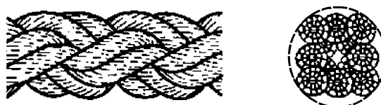
Рисунок 3 — Конфигурация 8-рядного плетеного каната (тип L)