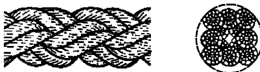
Рисунок 3 — Конфигурация 8-рядного плетеного каната (тип L)