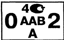
Рисунок А.3 - Поверительное клеймо, применяемое метрологической службой юридического лица при клеймении средств измерений, выпускаемых из производства