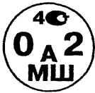
Рисунок А.1 – Поверительное клеймо ЦСМ