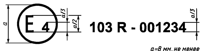
Образец А (См. 4.4 настоящих Правил)

Приведенный выше знак официального утверждения, проставленный на элементе сменного каталитического нейтрализатора, указывает, что данный тип был официально утвержден в Нидерландах (Е4) на основании настоящих Правил под номером официального утверждения 001234. Первые две цифры номера официального утверждения означают, что официальное утверждение было предоставлено в соответствии с предписаниями настоящих Правил в их первоначальном виде.