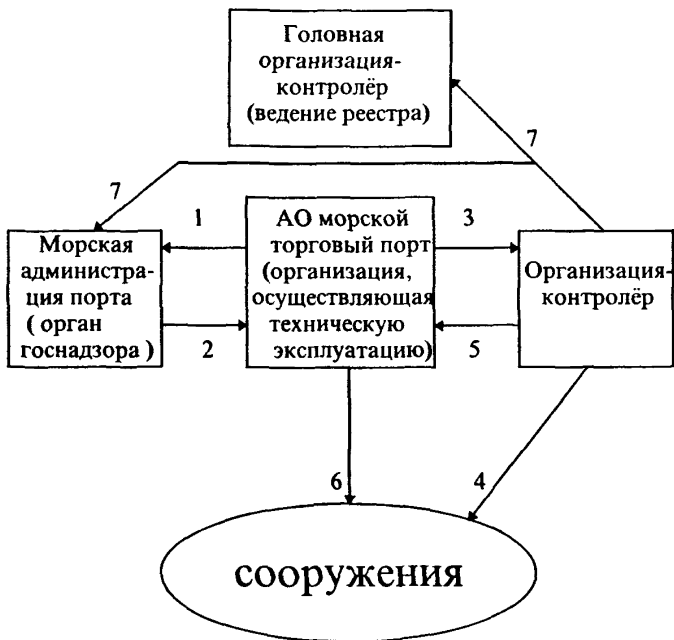
Рис. 5.1. Схема организации технического контроля сооружений: