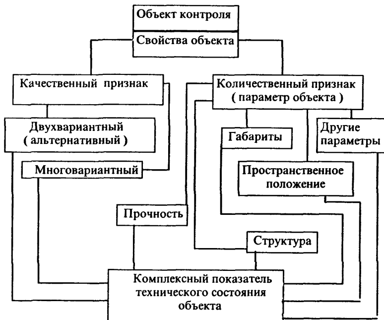
Рис.6.3. Схема определения технического состояния объекта по нормированным признакам.

6.5. Определение объема контроля сводится к выбору номенклатуры свойств объекта, характеризующих возможность его использования по назначению и определению признаков и параметров объекта, характеризующих эти свойства с необходимой и достаточной полнотой (рис.6.3).